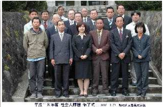
平成18年度 社会人課程 卒了式 2006.2.23 新潟県立長岡大学