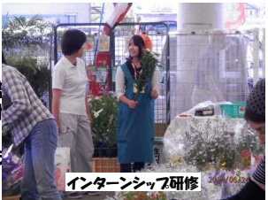
インターンシップ研修

「友よ集まれ!」追加入学試験願書受付中。 農業大学校一般(追)入試が3月18日に実施されます。受付期間は2月27日~3月13日です。 農業大学校では農業に関する専門的な知識や技術を学び、様々な資格試験取得に向けた授業を受けることができます。 また、学生寮を併設しており、食事の提供も行っているため、遠方の学生も安心です。 この学校で楽しく充実した2年間の学生生活を送ってみませんか。