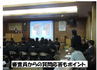
審査員からの質問応答もポイント。

「学生生活の集大成」卒業論文発表会。 農業大学校の2年生が2年間取り組んだ試験成果の取りまとめとなる卒業論文発表会が1月8日に開催されました。発表者の2年生22名は取り組みを10分間にまとめ、パワーポイントを使い、わかりやすく説明し、審査員からの質問に丁寧に答えていました。