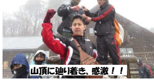
山頂に辿り着き、感激!!