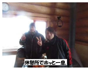
休憩所でホッと一息。

1月30日、小雨が降る悪天候の中、伝統の金剛山登山を強行いたしました。金剛山登山は毎年この時期に1年生全員で実施する伝統行事です。学生達は励まし合いながら、一歩一歩山頂を目指し、全員無事に登頂することが出来ました。昼食後、山頂では天候が雨から雪に変わりました。不意に広がった雪景色に息を飲み、疲れを忘れました。