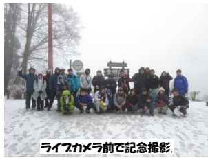
ライフカメラ前で記念撮影。

1月30日、小雨が降る悪天候の中、伝統の金剛山登山を強行いたしました。金剛山登山は毎年この時期に1年生全員で実施する伝統行事です。学生達は励まし合いながら、一歩一歩山頂を目指し、全員無事に登頂することが出来ました。昼食後、山頂では天候が雨から雪に変わりました。不意に広がった雪景色に息を飲み、疲れを忘れました。