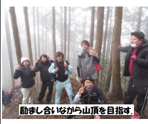
励まし合いながら山頂を目指す。