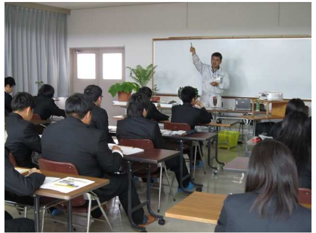
林業試験場の見学