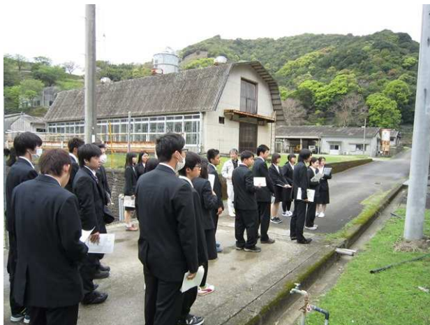
畜産試験場の見学