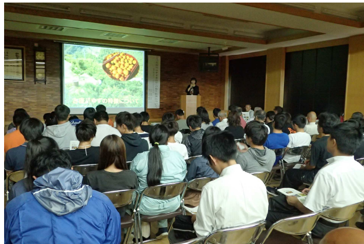
講演に熱心にメモを取る受講者

過疎化が進む地域でありながら、地域が一体となり人を呼び込むアグリビジネスに逞しさを感じました。