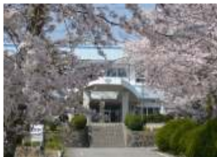
櫻並木が皆様をお出迎え