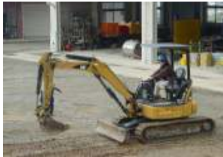
小型建設機械技能講習