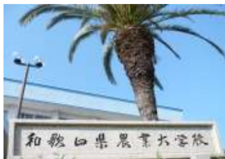
農大のシンボルフェニックス