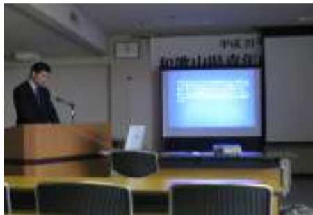
青年農業者会議で研究発表