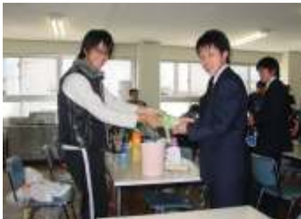
自治会主催新入生歓迎会