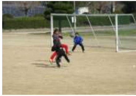
2年生の送別サッカー大会